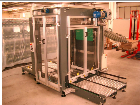
Vista dell'Impilatore MC28/A View of the MC28/A stacking machine